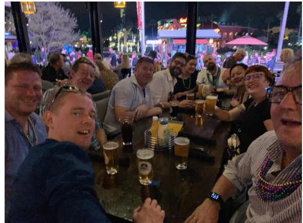
Sluttede så en lang dag af med at køre ud og se SpaceX måne affyring