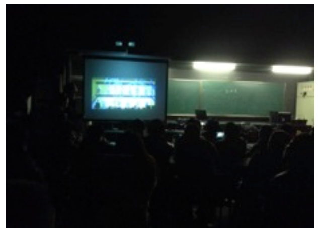
Hvordan man ikke skal holde foredrag

Med et lærred foran kateteret 2 lysstof rør i loftet over tavlen og så ellers helt mørkt. Her skal vi holde vores foredrag.